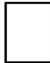
Huella Digital (índice derecho)